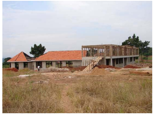
Unsere Hotelfachschule: Rundhäuser und Restaurant mit Lehrräumen